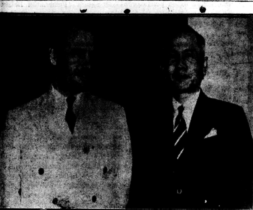
Perdana Menteri Siam, Phibun Songgram (kanan) bersama Komisaris Tinggi Inggris untuk Malaya Mr. Malcolm Mac Donald, sewaktu jang belakangan ini datang berkunjung ke Bangkok. Katanja telah diperoleh kata mufakat antara mereka berdua untuk bekerja sama dalam berbagai hal.